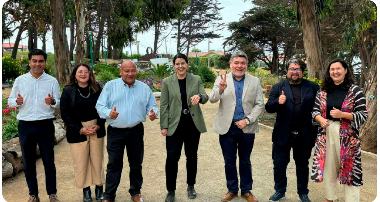
La Subsecretaria de Desarrollo Regional, Francisca Perales, junto al alcalde Rolando Silva; la Subsecretaria de Minería, Suina Chahuán, el diputado Nelson Venegas y autoridades regionales y locales, anunciaron que la comuna accederá a recursos del Fondo de Comunas Mineras.

“Quiero también destacar y agradecer la gestión del diputado Nelson Venegas, quien nos acompañó en múltiples oportunidades donde pudimos exponer nuestros puntos de vista. Gracias a este esfuerzo en conjunto, Quintero fue considerada a partir del año 2026 como comuna beneficiaria del Royalty Minero, un avance que refuerza el reconocimiento hacia nuestro territorio y su contribución al país”, destacó el jefe comunal.